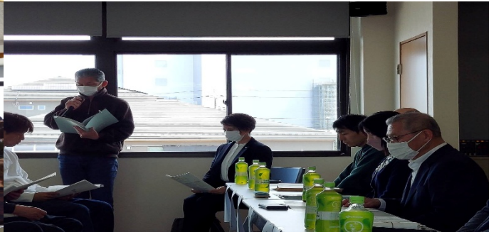
選考委員長より役員選考結果報告