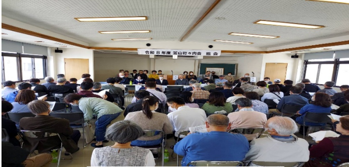
開会～市民権暑唱和