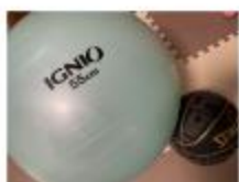
バランスボール バスケットボール