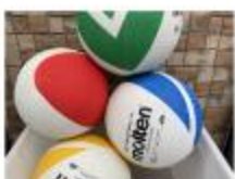
ソフトバレーボール